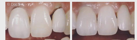
Metallkeramik-Kronen mit dunklen Rändern (links) und ästhetische Kronen aus reiner Keramik (rechts).

Wenn Sie wirklich schöne Zähne wollen, sollten Sie sich für Kronen und Brücken aus reiner Keramik entscheiden.